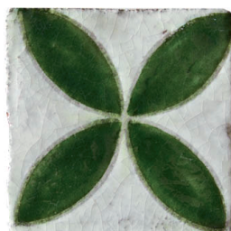
Malena vert 10x10