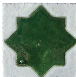
Alcala vert 10x10