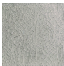
Craquelé Miel 10x10