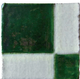
Bailen vert 10x10