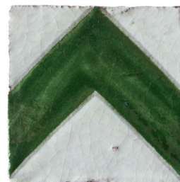
Melo vert 10x10