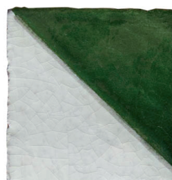
Aile d'Hirondel. vert artisanal 10x10