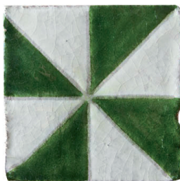
Huela vert 10x10