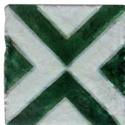
Adra vert 10x10